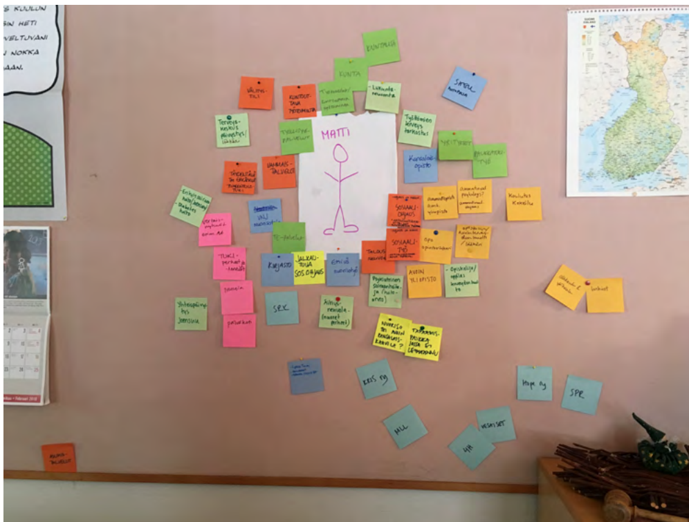
Kuva 3. Kolmas vaihe "Nuori palveluuiidakossa" .

Vaihe 3: Siirretään palveluja siten, että saadaan muodostettua paikkakunnan palvelujen tavoitela suhteessa nuoreen. Neonkeltaiselle post it -lapuille pystyy kirjaamaan ylös niitä palveluja, jotka alueelta puuttuvat ja joita kaivataan.