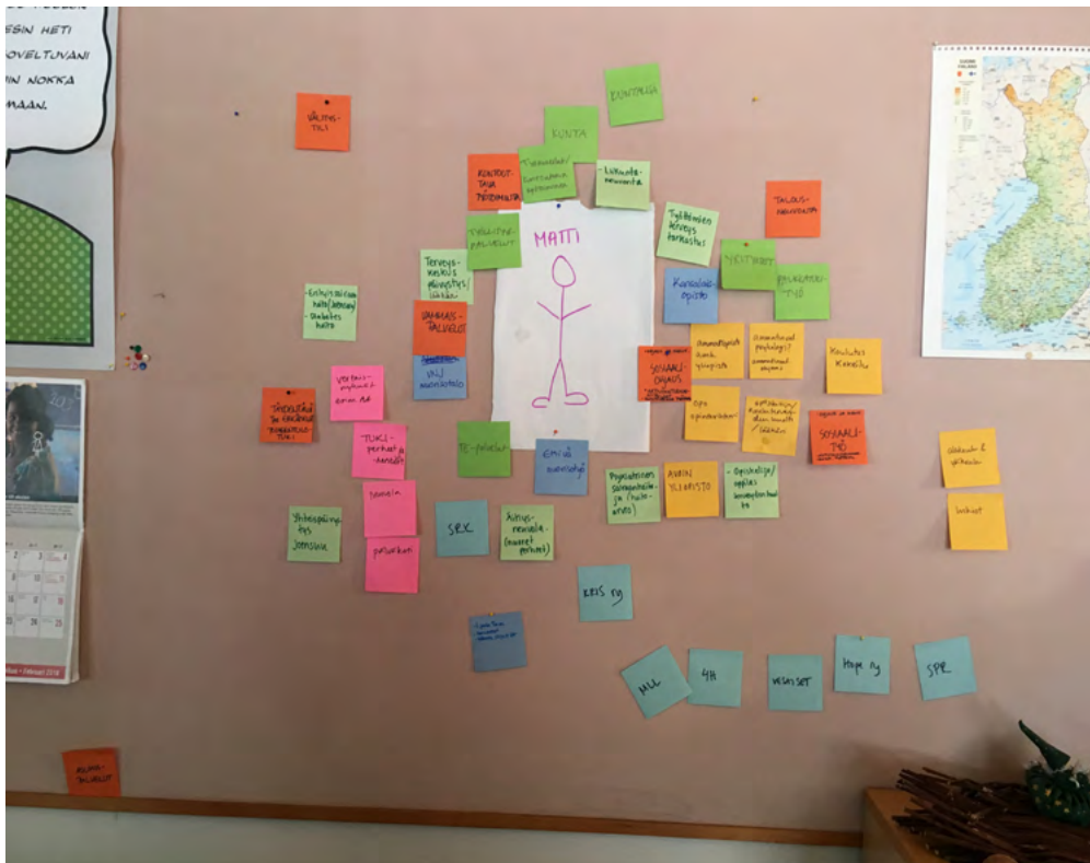
Kuva 2. Toinen vaihe "Nuori palveluuiidakossa" .

Vaihe 3: Siirretään palveluja siten, että saadaan muodostettua paikkakunnan palvelujen tavoitela suhteessa nuoreen. Neonkeltaiselle post it -lapuille pystyy kirjaamaan ylös niitä palveluja, jotka alueelta puuttuvat ja joita kaivataan.