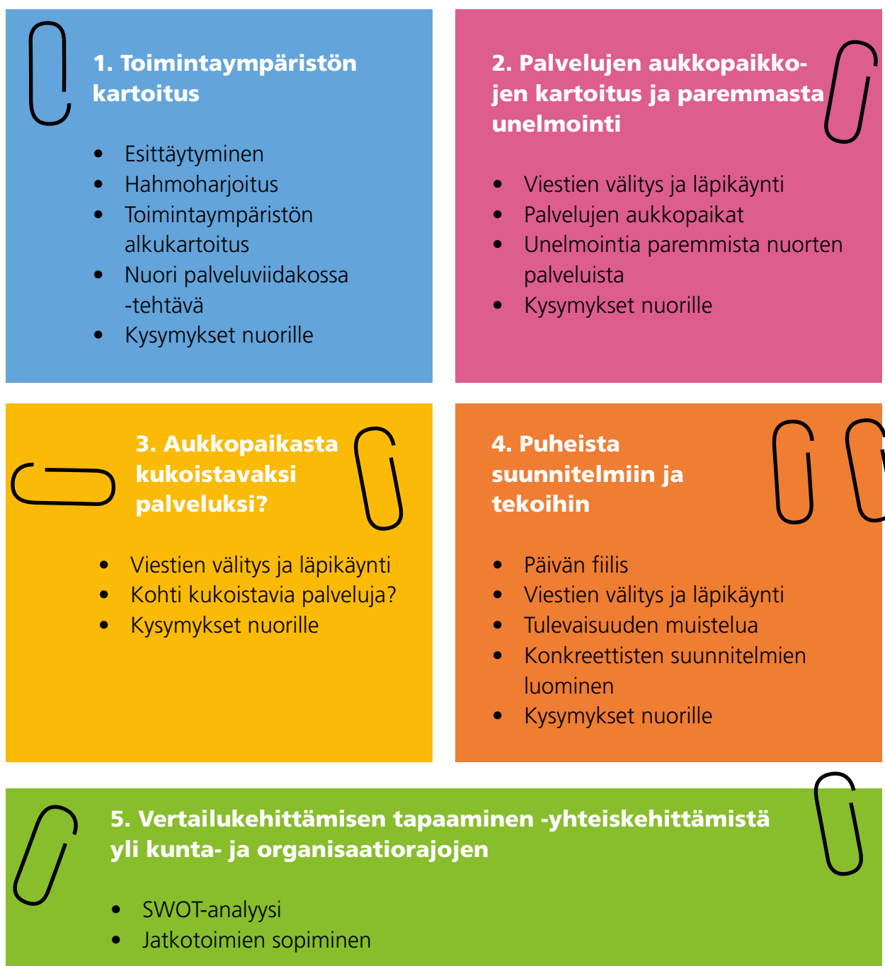
Kuvio 2 Yhteiskehittämispajojen eteneminen.