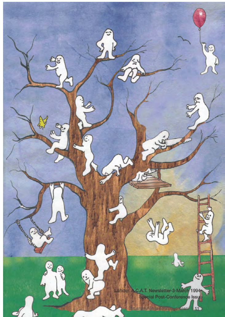
Kuva 1. Hahmopuu-harjoitus.

Harjoitus toimii tunnelman keventäjänä ja oivana irtiottona työkiireestä sekä orientoitumisena yhteiskehittämiseen.